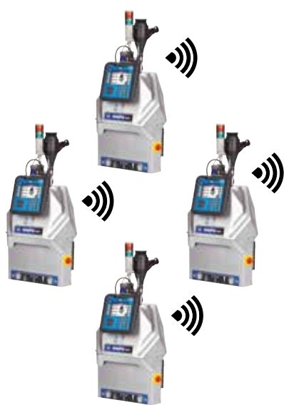
Número de equipos en planta